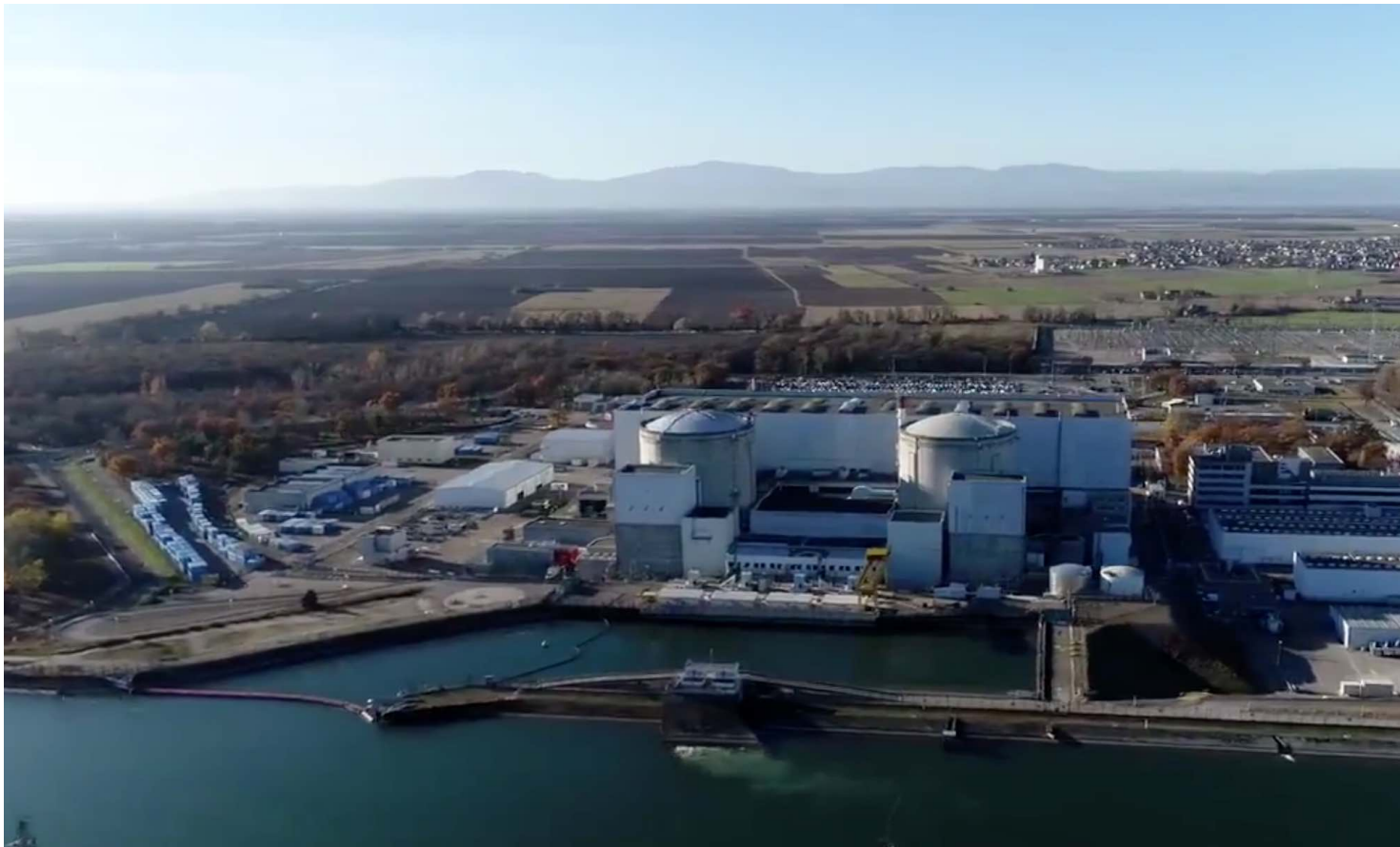
La centrale de Fessenheim

À lire les réactions accompagnant dans la presse et les réseaux sociaux la fermeture de la centrale nucléaire de Fessenheim, à la fois vives et même émouvantes – le cœur de Fessenheim commence à cesser de battre, dit un twitos photo à la clé – je prends conscience de la gravité de la décision prise par le gouvernement de François Hollande – merci Ségolène Royal, quel couple infernal – en décidant d'accorder aux écologistes une fermeture progressive mais bien réelle des moyens français de production d'énergie les plus décarbonnés. Et aussi les moins chers dans la durée.